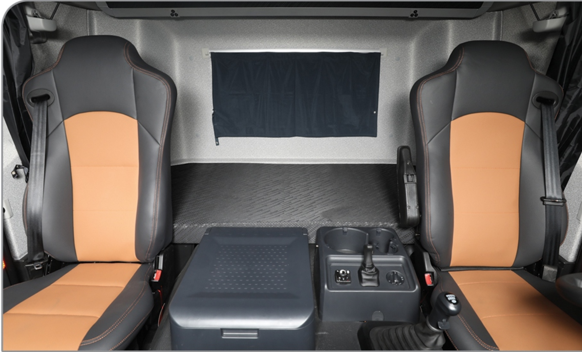
تخت خواب بزرگ