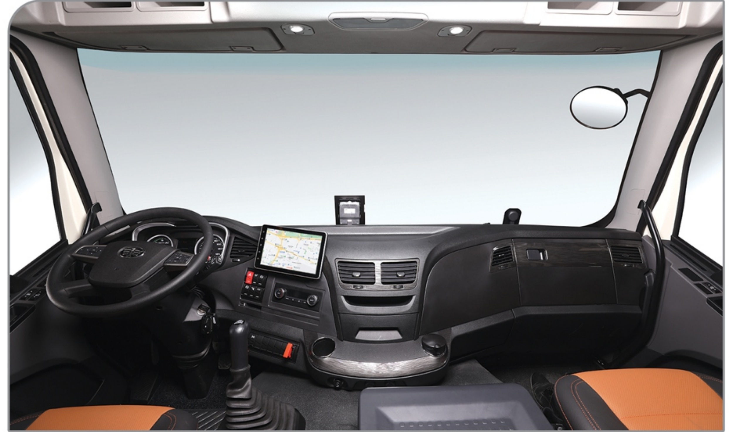
کابین بزرگ، ارگونومیک و مدرن