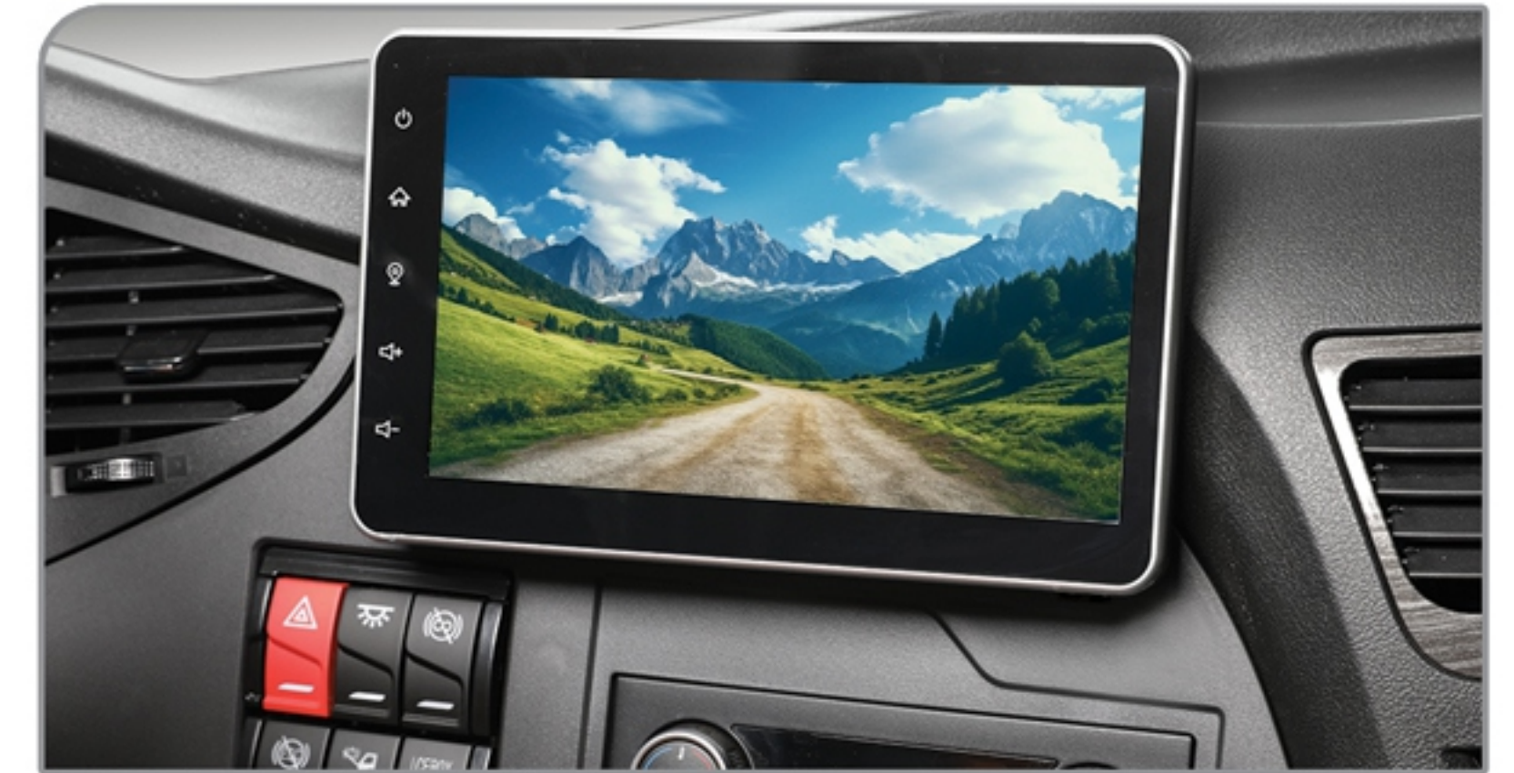
مولتی مدیا TFT لمسی (رادیو، رهیاب، بلوتوث، USB، SD)