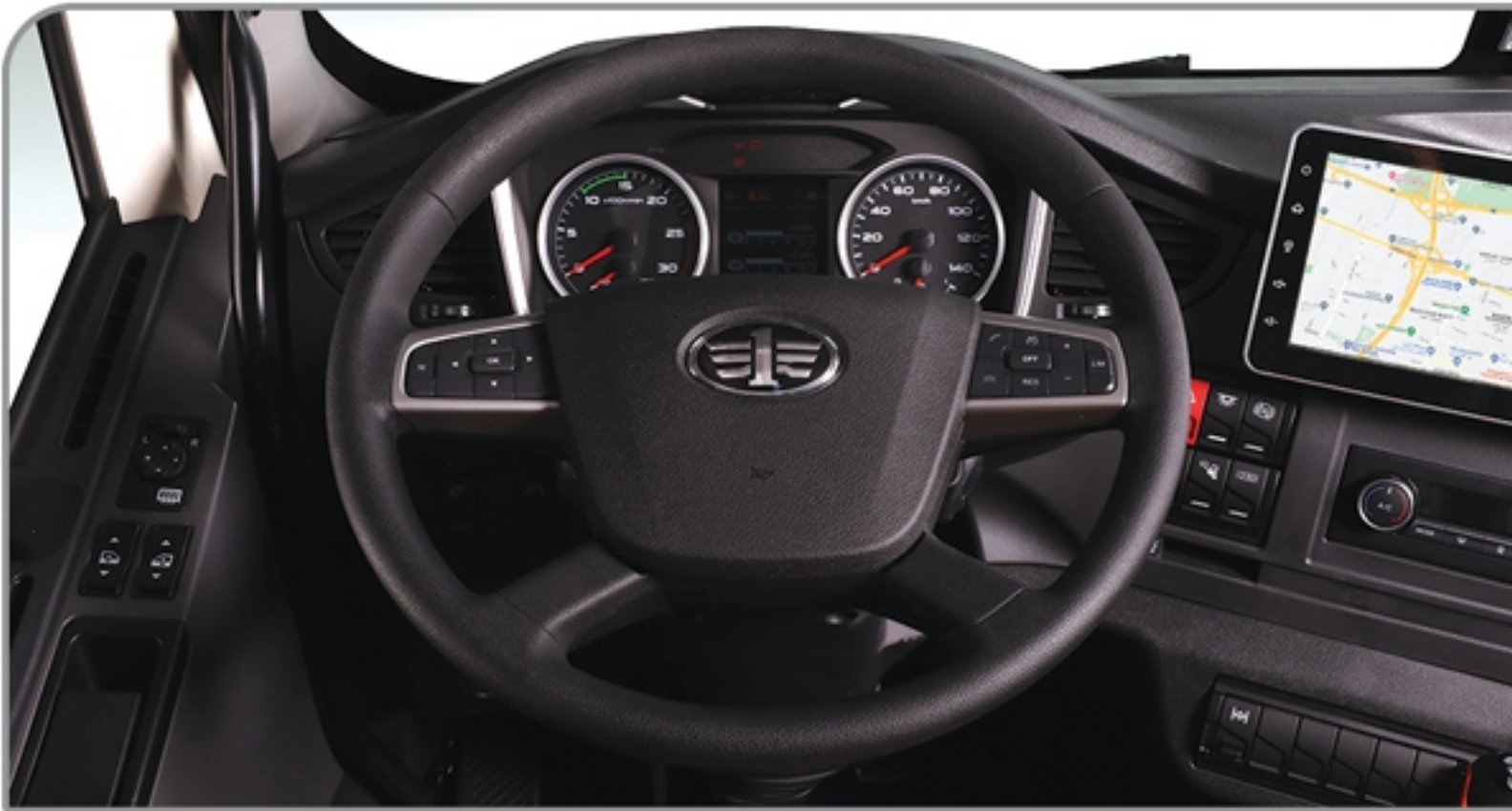
غریبک فرمان مجهز به کلیدهای دسترسی به مولتی مدیا و کروز کنترل