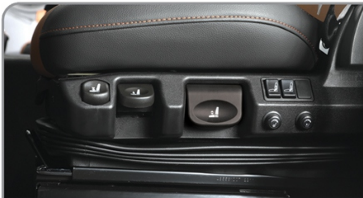
صندلی راننده با تعلیق پنوماتیک، دارای گرم کن و سردکن و قابلیت تنظیم در ۶ جهت