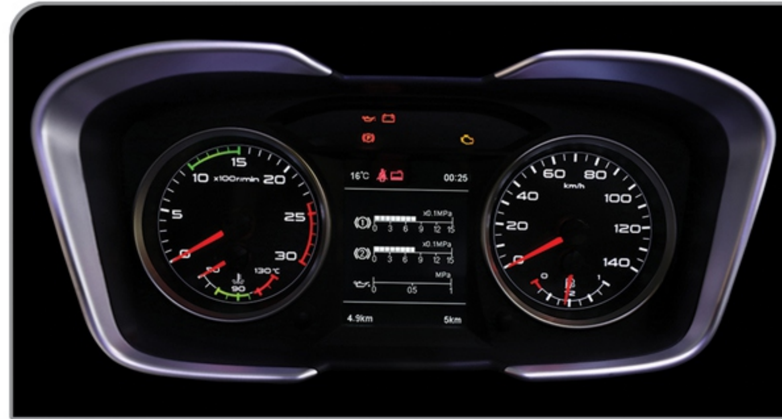
جلا آمپر با صفحه نمایش