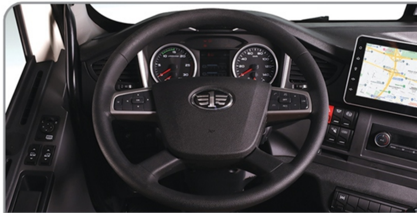
غریبک فرمان مجهز به کلیدهای دسترسی به مولتی مدیا و کروز کنترل