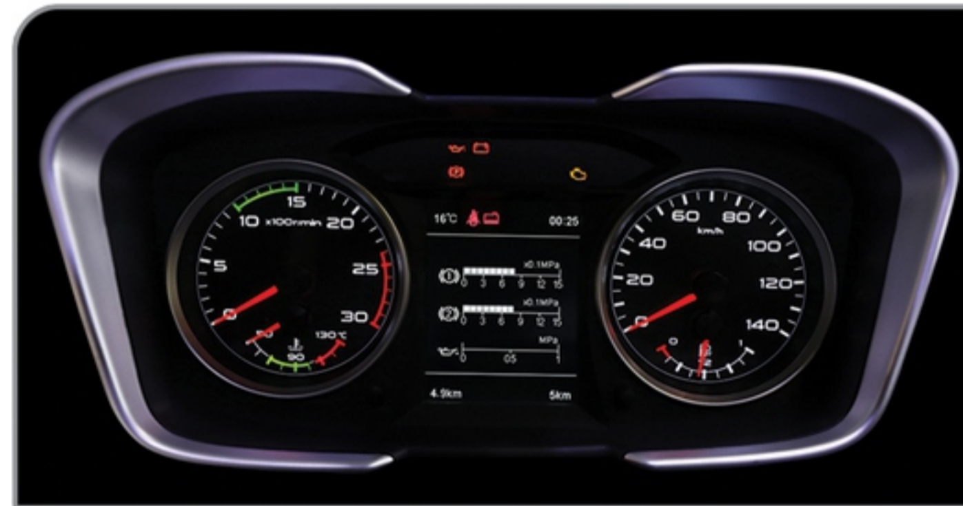
جلو آمپر با صفحه نمایش